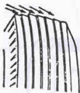
FIGURA 11-22 Patrón de desgaste en forma de filo de pluma.